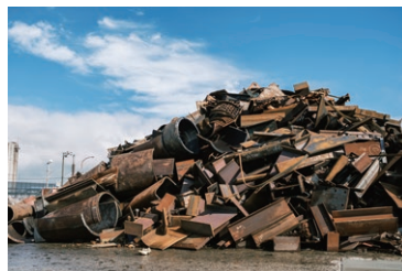
製鋼原料（鉄スクラップなど）

全国の港に集荷した鉄スクラップを、顧客のニーズに沿った品質管理を行った上で、国内外の鉄鋼メーカー（高炉・電気炉）へ販売しています。ベトナムをはじめ、東南・南西アジアの鉄鋼需要拡大に伴い、日本国内集荷拠点を新設・拡大し、集荷量を増大させています。また輸送に対する物流方法も多様化する中で、バルク船（大型船、小型船）、コンテナ輸送も積極的にを行い、国内、近隣アジア、遠方への販売体制を構築し、鉄鋼資源の世界各国への販売を行っています。